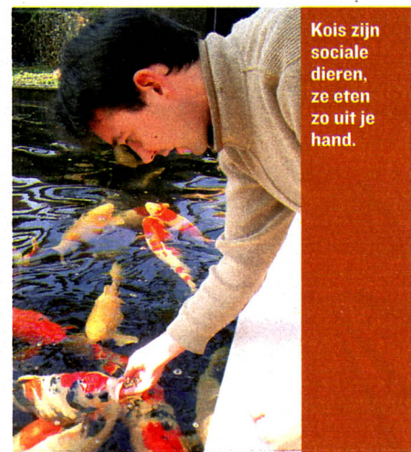
Kois zijn sociale dieren, ze eten zo uit je hand.

Voor een consultatie bij dokter Lammens mag u 50 à 70 euro rekenen. Voor een behandeling of operatie betaalt u uiteraard een pak meer.